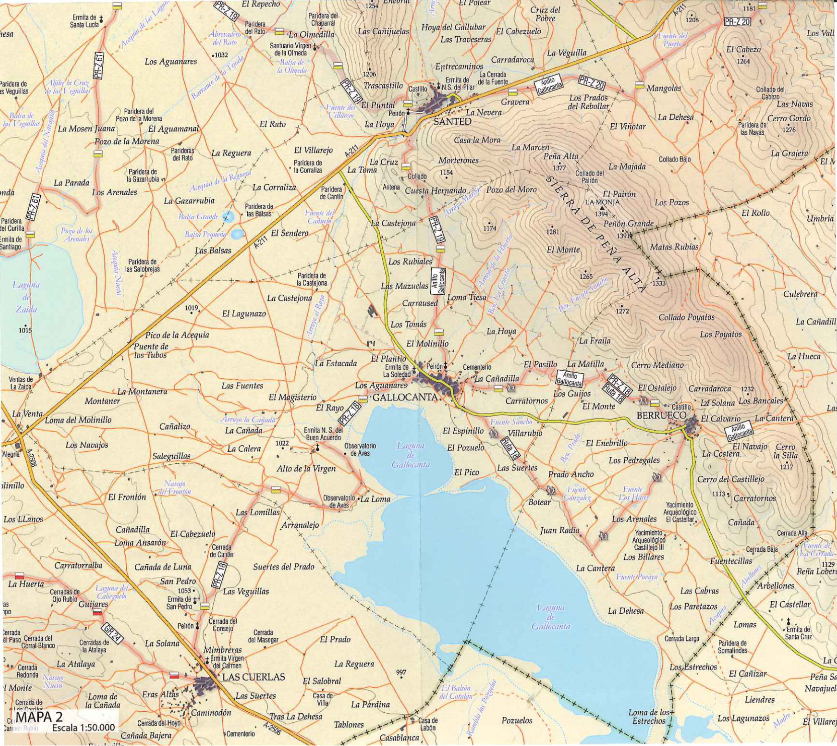
MAPA 2 Escala 1:50.000