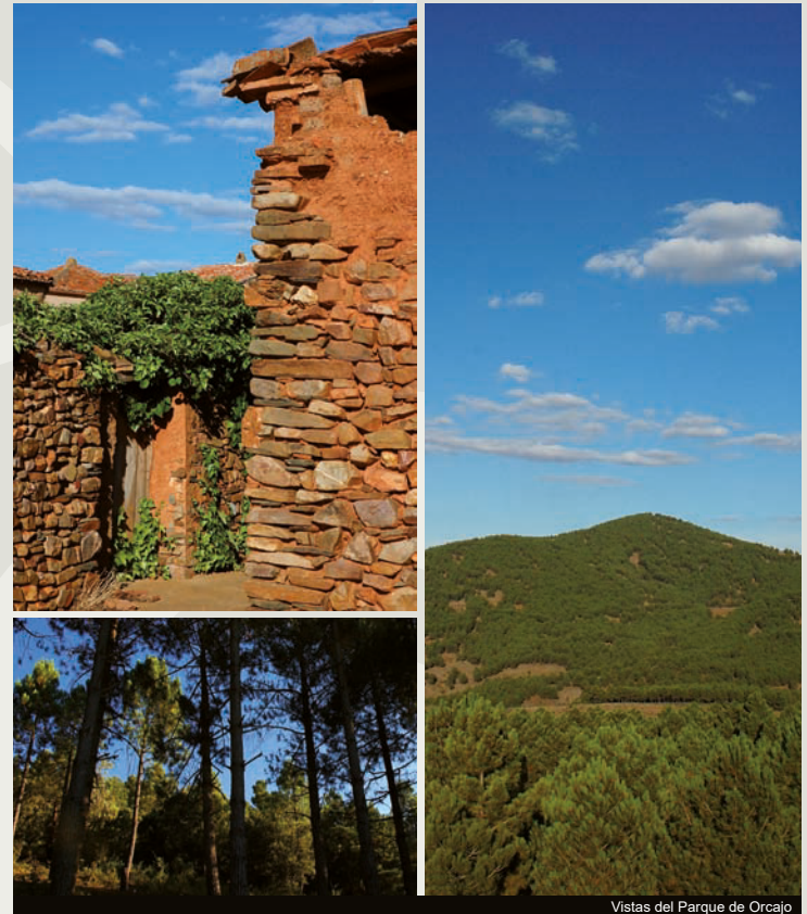
Vistas del Parque de Orcajo

De entre todas estas repoblaciones realizadas con pinos, por regla general carrasco, negral y rodeno, el ingeniero de Montes de la obra decidió permitirse una curiosa licencia: en el lado izquierdo del valle, sierra de Santa Cruz y monte de Orcajo, a 1200 metros de altitud, en orientación norte y sobre una ladera de fuerte pendiente, mezclaría la plantación de pino rodeno con abetos pinsapos, una especie adaptada exclusivamente a la serranía andaluza de Ronda y norte de Marruecos.