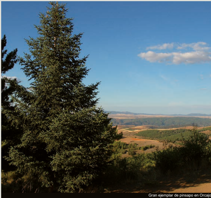
Gran ejemplar de pinsapo en Orcajo

Por esto, en 1907 se realizó un estudio hidrológico-forestal para prevenir las riadas. Se construyeron sistemas de diques de mampostería repartidos por todos los barrancos del valle y se realizó una repoblación forestal mediante especies resinosas. De este modo se evitaría el lavado de sedimentos y se realizaría una contención de la fuerza del agua.